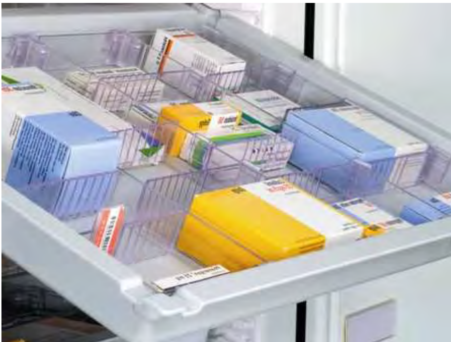
In Modulen (z.B. Spital & Pflegeheim)