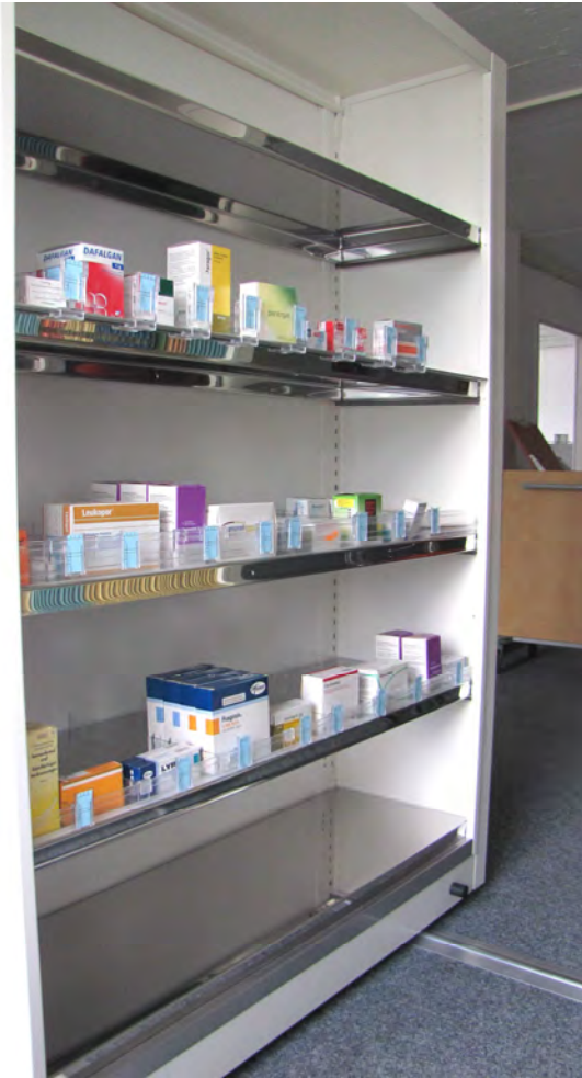
Ausgestattet mit Edelstahl- Tablaren