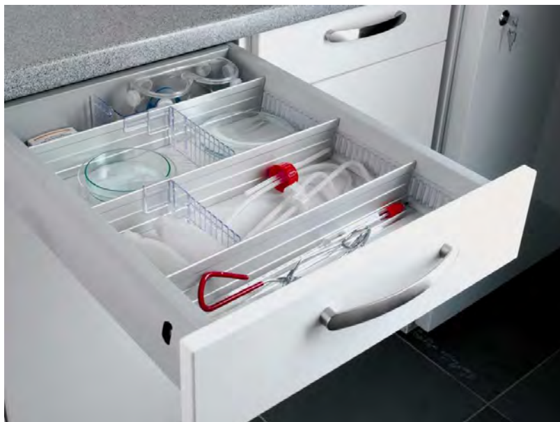
In Fertigschubladen (z.B. Labor)