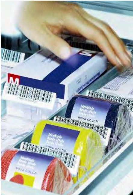
In Metallschubladen (z.B. Spital)