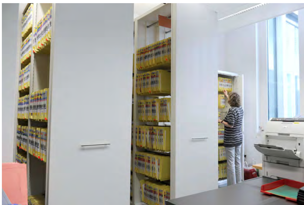
Grossanlagen auch bei begrenzten Platzverhältnissen