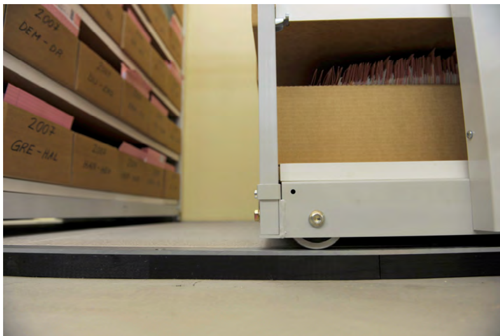
Niedrige Ausführung von Podest- und Wagenrahmen