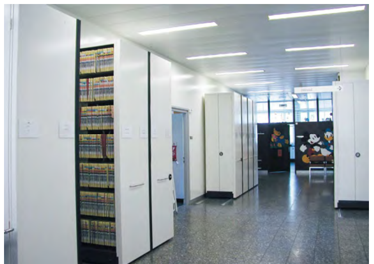
Abschliessbare Module für den Zugriff im Flurbereich