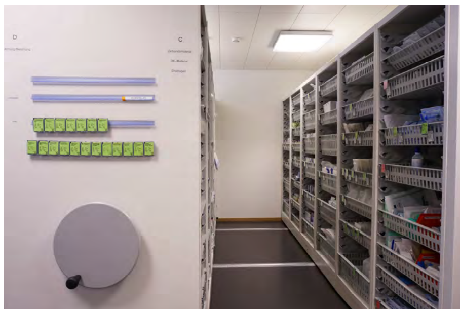
Rollregalanlage inkl. Moduleinbauten für Medikation und OP

Ob für Medikamente, Sterilgut, Ordner, Hängeregistraturen, Stehkassetten, Vertikalauszüge oder einfache Tablare für jeden Zweck.