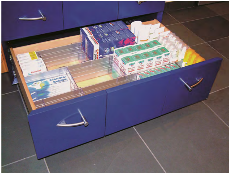
In Holzschubladen (z.B. Apotheke)